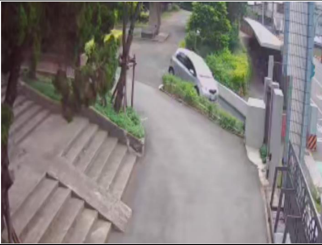
8.校門口出入動線人車分流。