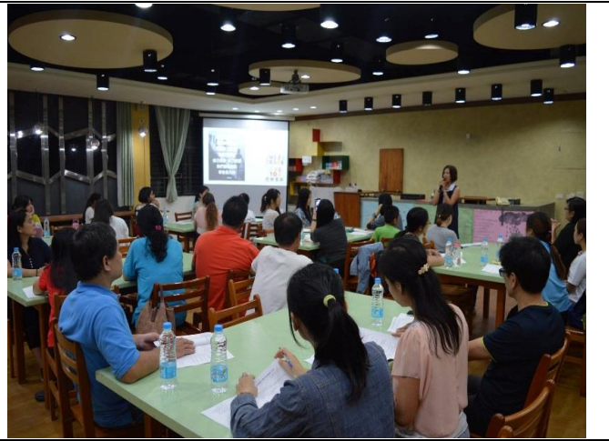
3.每學期期初及親師座談會，皆會與家長宣導學校上放學方式。