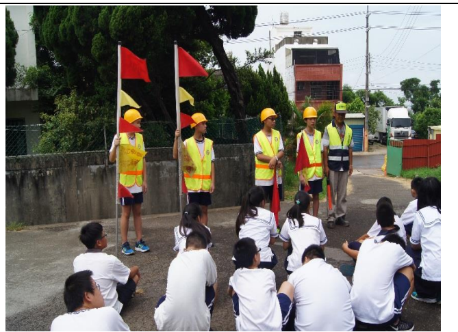
6-1 定期訓練交通糾察指揮交通。