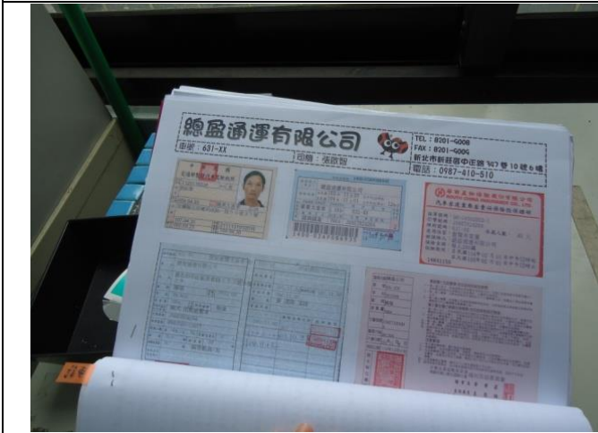
5-2 校外教學前車輛安全檢查。