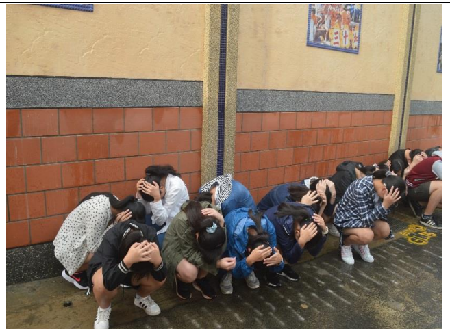
5-3 校外教學行前說明會與逃生演練。