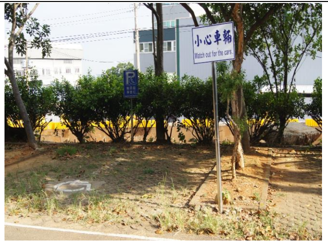
5-1 校內交通情境設置。