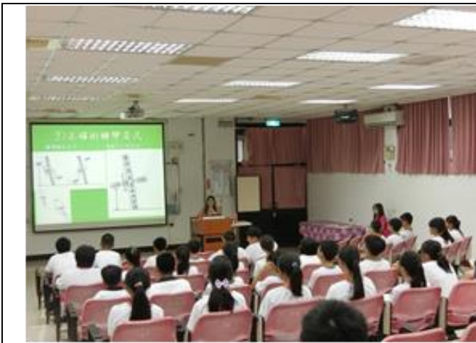
12.七年級腳踏自行車安全騎乘宣導。