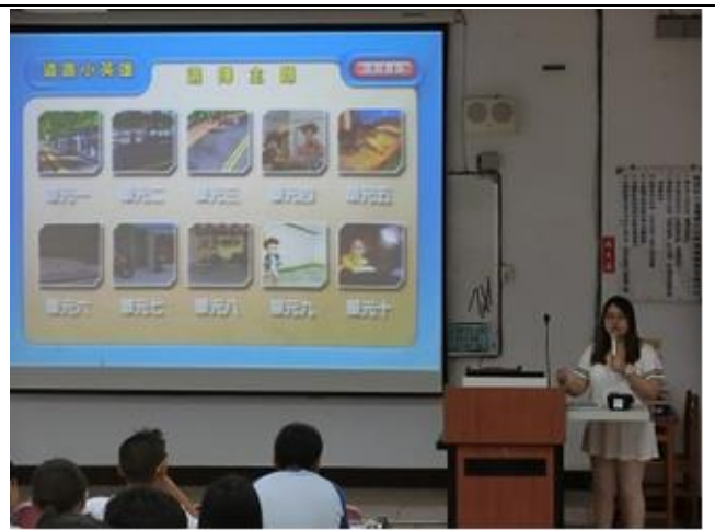
12.八年級「路口停讓，安全至上」宣導。