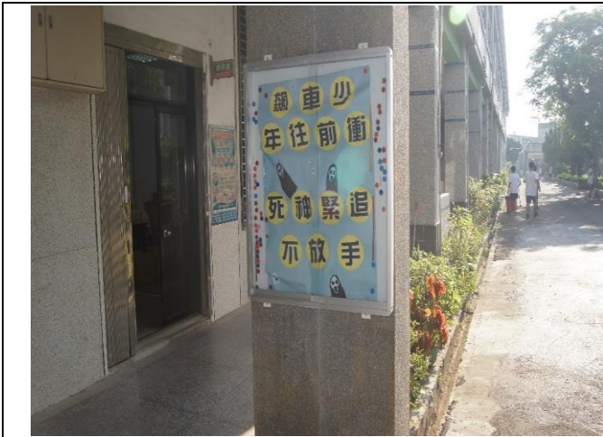
5-1 校園各處與穿堂皆設有交通標語。