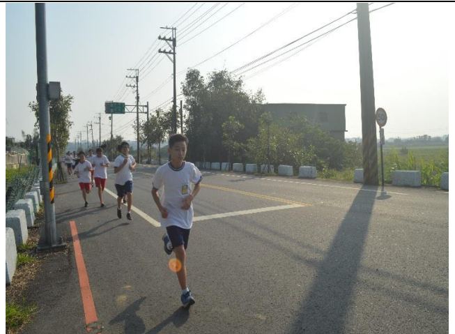
12.每學年辦理一次越野賽跑。