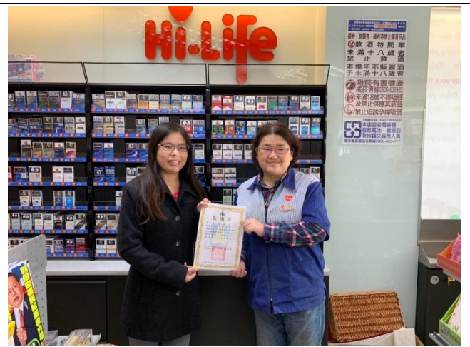
11. 建立選定愛心商店的安全評估程序。