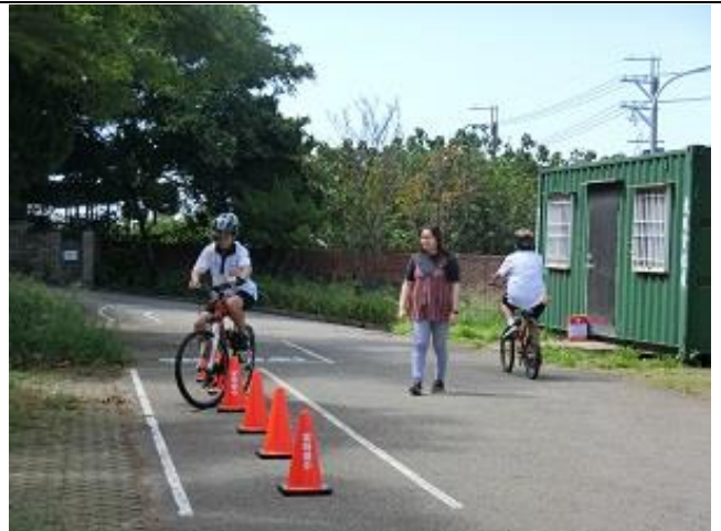
10.要求本校學生騎乘腳踏車佩戴自行車安全帽，若不符規定，則予以勸戒。