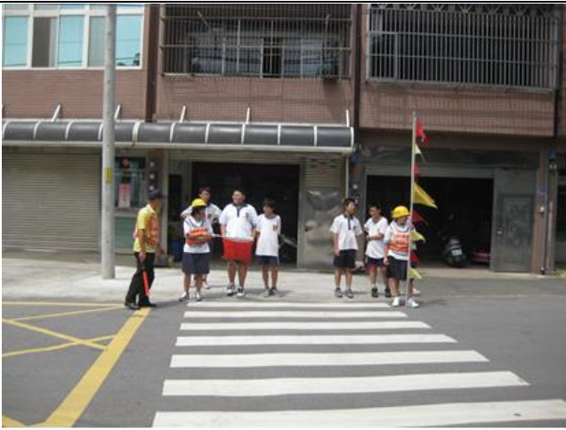
9.由校警擔任交通總指揮以及學生擔任交通糾察。