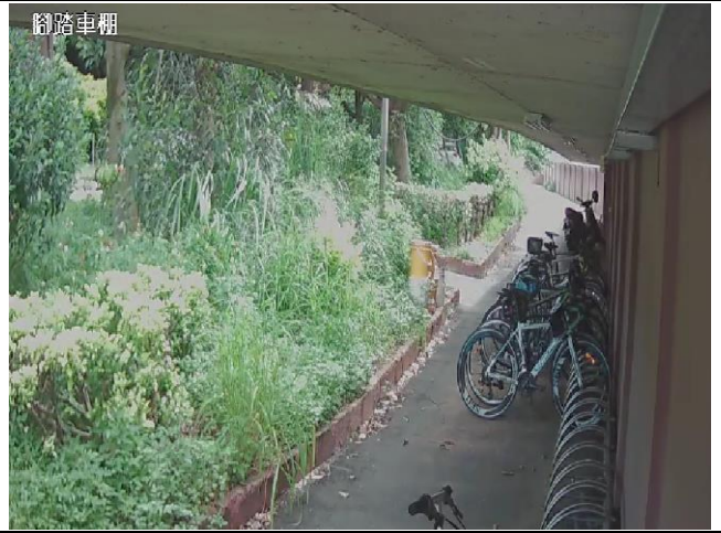
8.自行車與機車停放於車棚，汽車停放於停車場