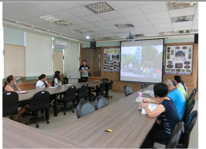
2.本校每學期固定辦理交通安全宣導講座。