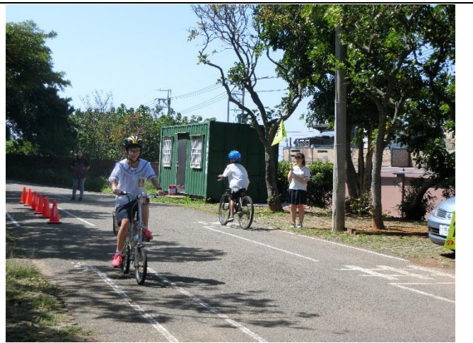
6-2 定期考自行車交通安全常識測驗與自行車路考。