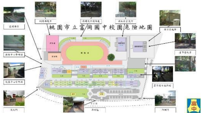
校園交通動線配置圖