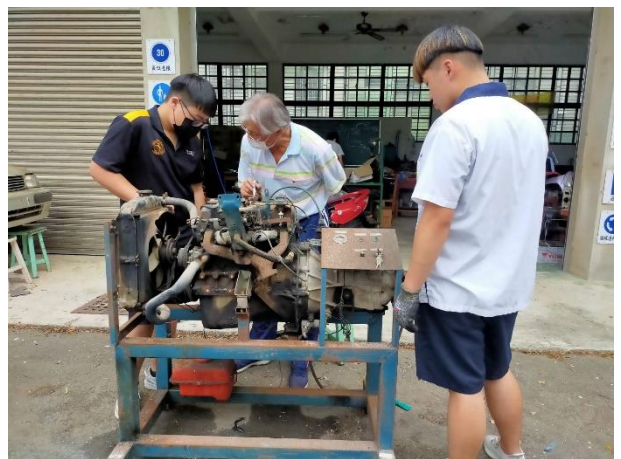
九年級動力機械技藝教育課程