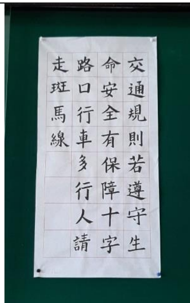
交通安全標語書法競賽