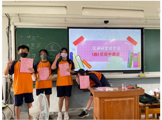
協助教育局辦理桃園市 112 年度「交通安全教育課程實施計畫」