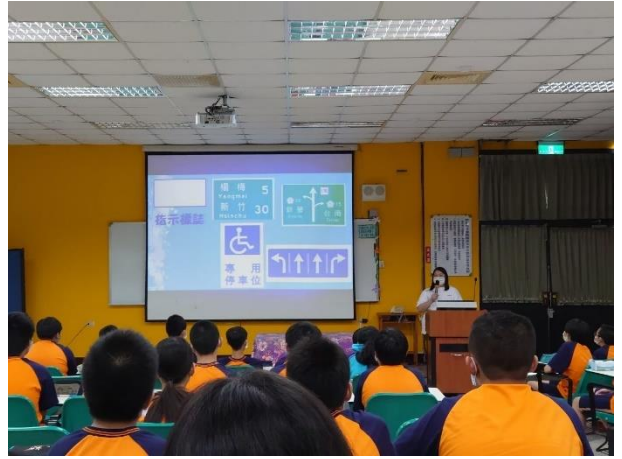
安全駕駛教育宣導