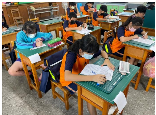
自行車交通安全法規測驗