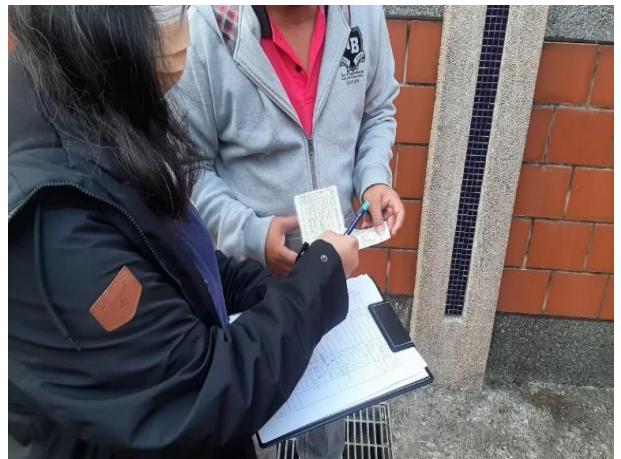
戶外教育前車輛安全檢查