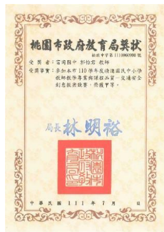
數學領域結合交通安全教育議題教學，榮獲桃園市110學年度交通安全創意教案比賽甲等。