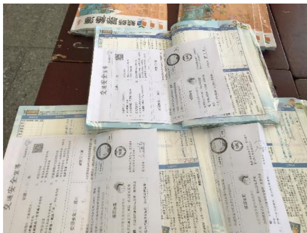
不定期於校網、中廊、班級布告欄及聯絡簿張貼交通安全教育宣導事項。