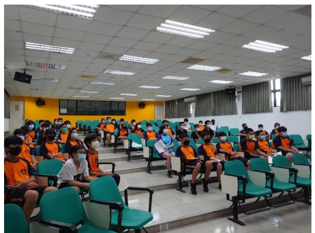
交通安全五守則宣導