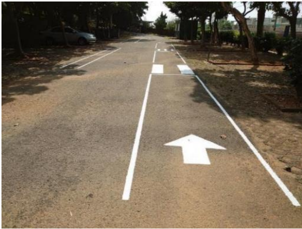
校園一角設有自行車考照專區