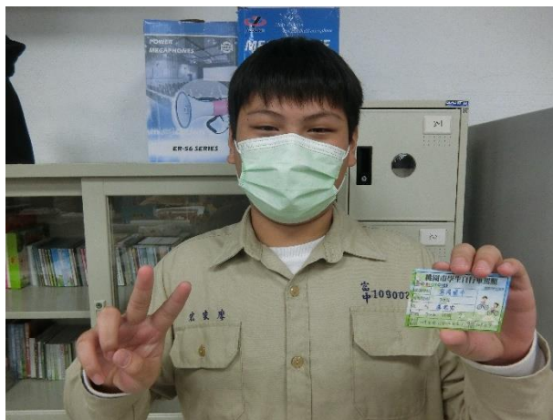
訂定並實施學生自行車管理辦法。