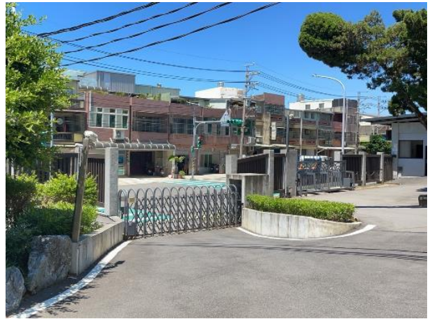
校門口出入動線人車分道