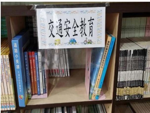
交通安全教育資料櫃