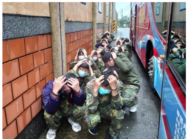
戶外教育前逃生演練