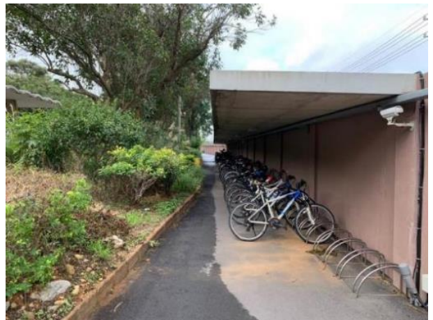
自行車與機車停放於車棚