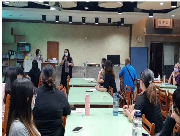
每學期期初皆會向家長宣導學校上、放學方式及交通安全注意事項。