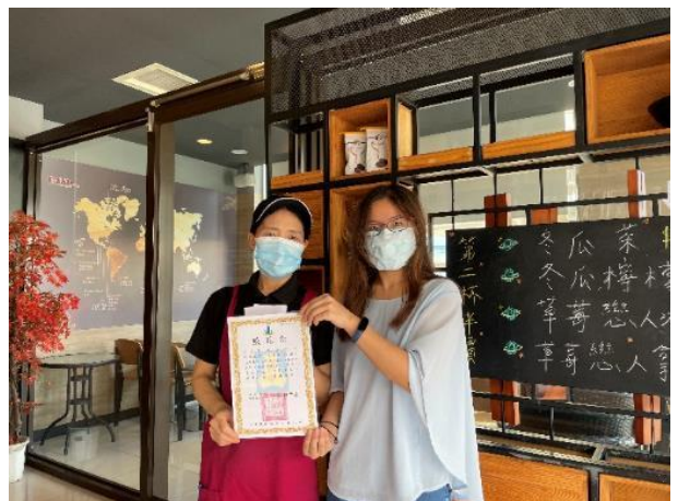
建立愛心服務站，維護學生通學安全。