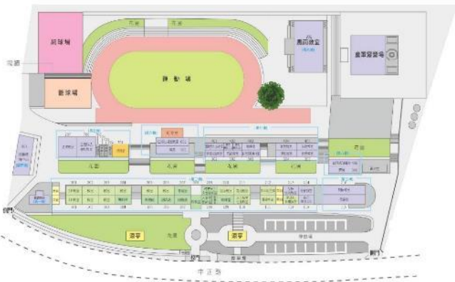
桃園市立富岡國民中學校園配置圖 Fugang Junior High School, Taoyuan County Floor Plan