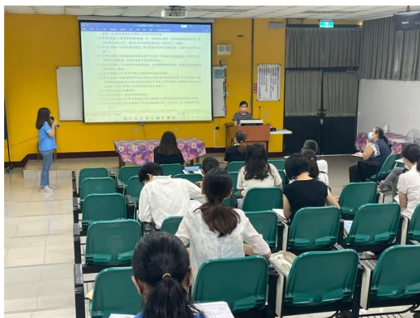
於校務會議規劃、檢討交通安全教育相關事宜。