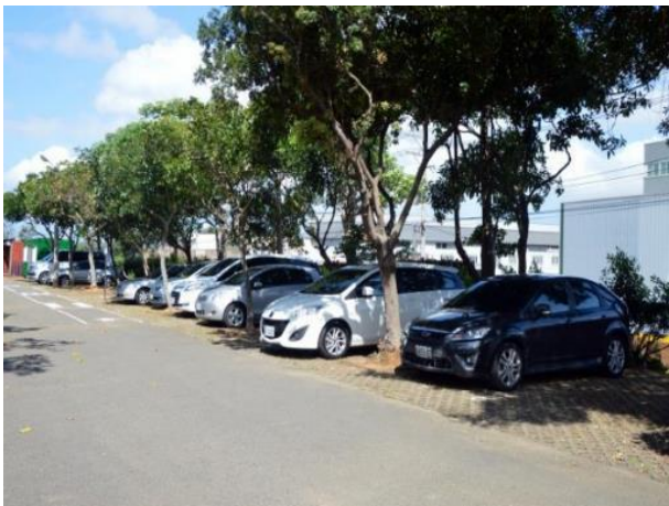
汽車車頭向前停放於停車場