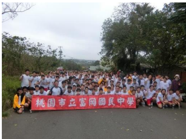
舉辦七、八年級光復圳越野賽跑