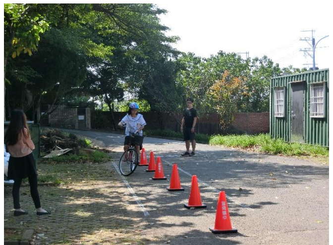
定期考自行車交通安全常識測驗與自行車路考。