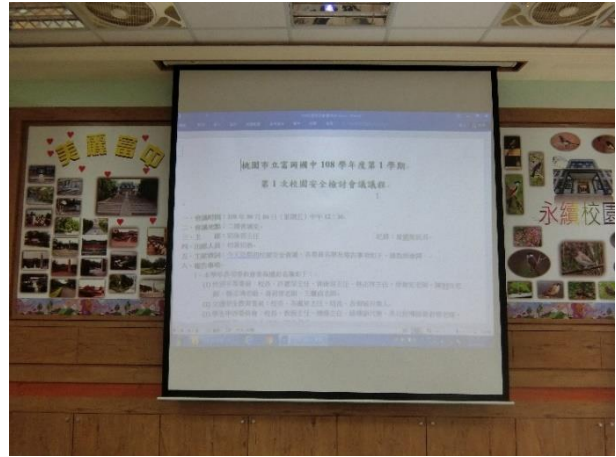
桃園市立富岡國中 108 學年度第 1 學期行事曆