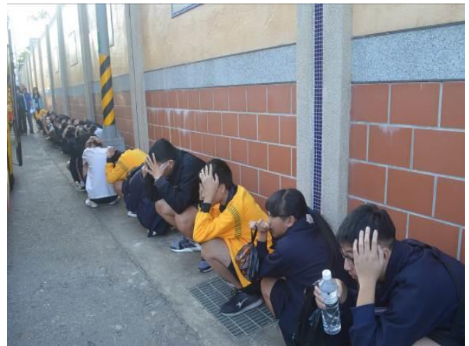
校外教學行前說明會與逃生演練。