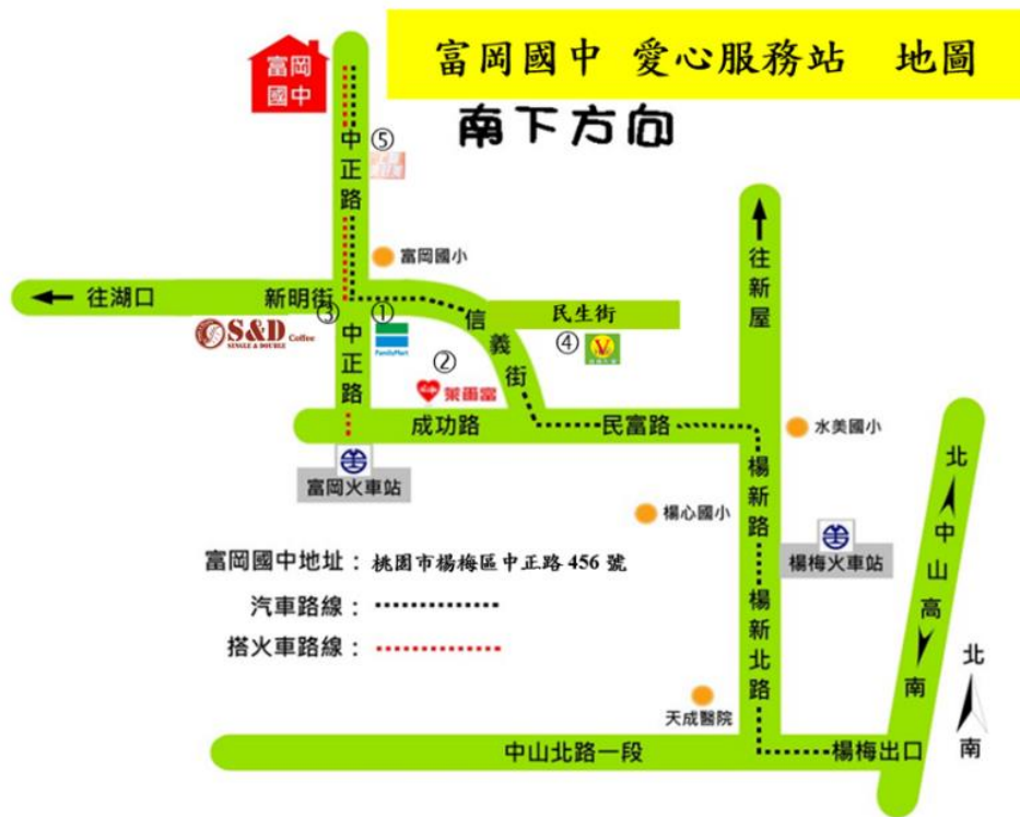
針對愛心服務站的位置製作說明圖示。