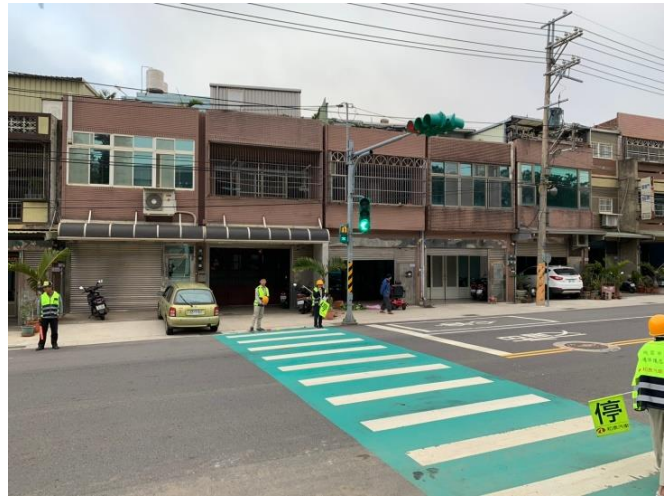
定期訓練交通糾察指揮交通。