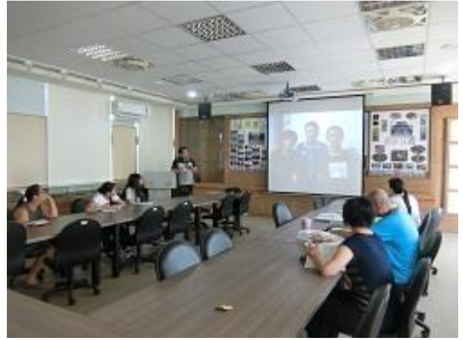
本校每學期固定辦理教師交通安全宣導講座。