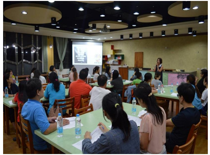
每學期期初及親師座談會，皆會與家長宣導學校上、放學方式。