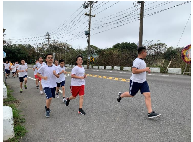
每學年辦理一次越野賽跑。