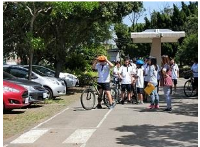
要求本校學生騎乘腳踏車佩戴自行車安全帽，若不符規定，則予以勸戒。