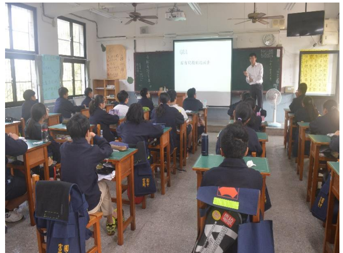
班會課結合教育局宣傳影片，宣導交通安全。